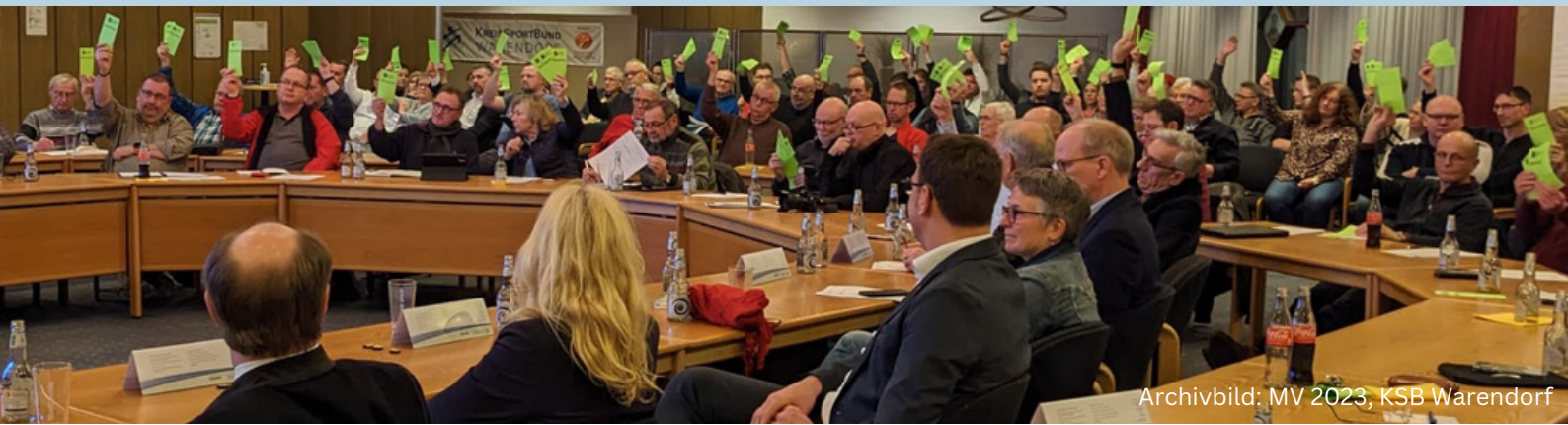
Archivbild: MV 2023, KSB Warendorf